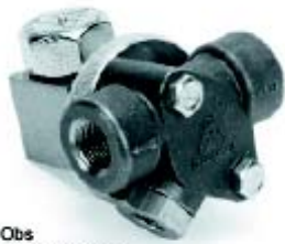
Obs Med konnektor